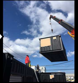
建築確認申請対応 将来、移動も可