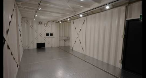
1F：女性でも入庫しやすい広い間口の電動シャッター・倉庫としても利用可