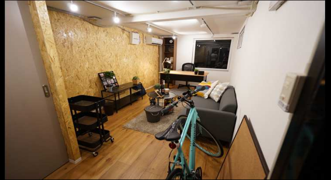
2F：事務所や趣味の空間としてカスタマイズ自由。エアコン完備